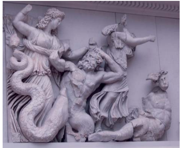
Tanrıların devlerle savaşlarından bir friz