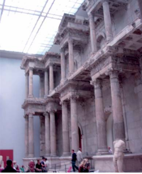
Tarihi Milet Pazar Yeri Kapısı MS 120